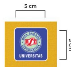
Gambar 3. Desain Kaos NIM Digit Terakhir Genap