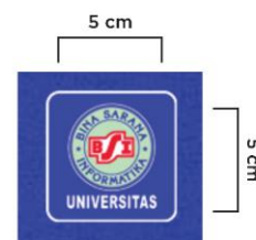
Gambar 1. Desain Kaos NIM Digit Terakhir Ganjil