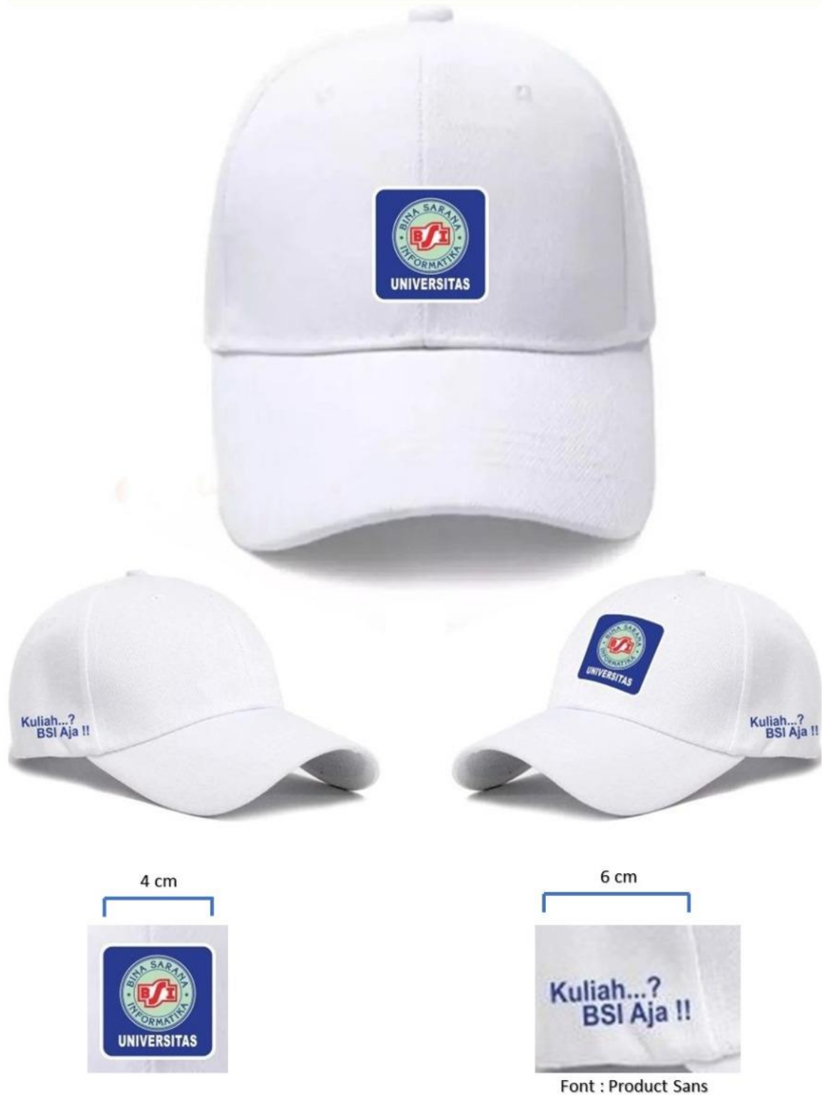
Gambar 2. Desain Topi NIM Digit Terakhir Ganjil