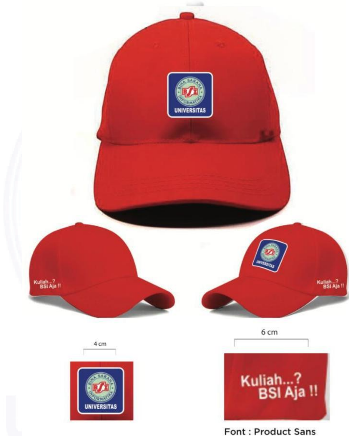
Gambar 4. Desain Topi NIM Digit Terakhir Genap