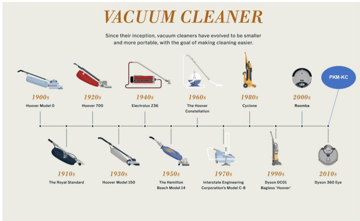
Gambar 2. Perkembangan vacuum cleaner dari tahun 1900 ke 2010 an

Berdasarkan uraian di atas PKM-KC lebih menekankan pada kreativitas produk/prototipe yang akan dihasilkan, level teknologi, keterbaruan, metode pembuatan produk serta prediksi tingkat kemanfaatannya.