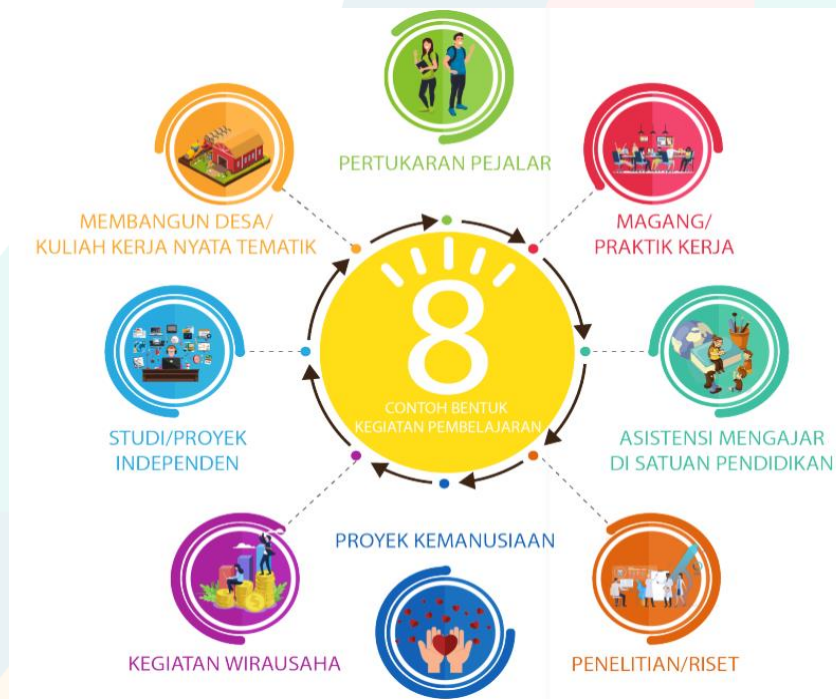
Gambar 4. Bentuk kegiatan pembelajaran sesuai dengan Permendikbud No 3 Tahun 2020 Pasal 15 ayat 1

Bentuk kegiatan pembelajaran yang sesuai dengan PKM-KC adalah Studi/Proyek Independen seperti terlihat dalam berikut.