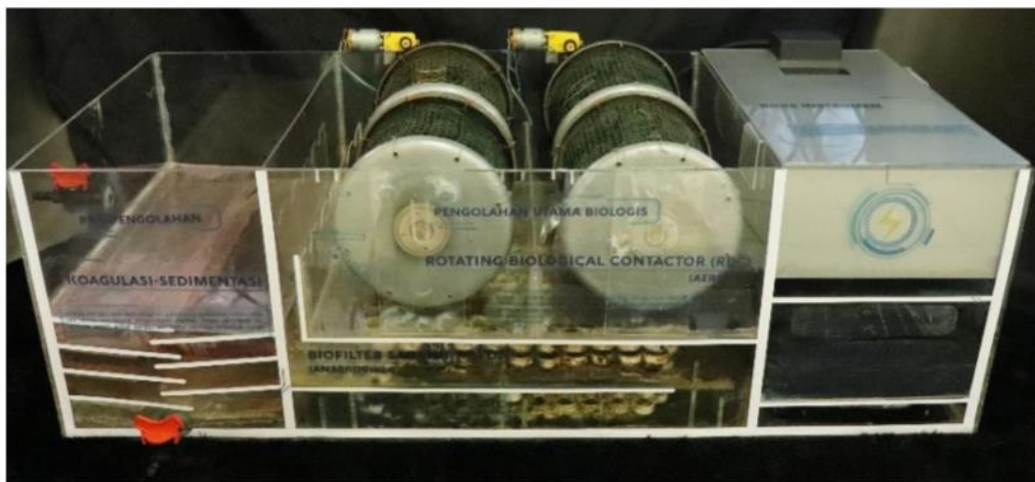
Gambar 1. Reaktor Pengolahan Limbah Cair Tekstil Berbasis Hybrid Attached Growth Biofilm Terintegrasi Arduino (Rahmadi et al. (2022)).

Prototipe alat yang diciptakan ini berhasil mengolah lebih banyak air limbah dalam waktu lebih singkat jika dibandingkan dengan unit pengolahan RBC konvensional. Efluen air limbah yang dihasilkan alat ini memenuhi baku mutu dan aman untuk dibuang ke lingkungan.